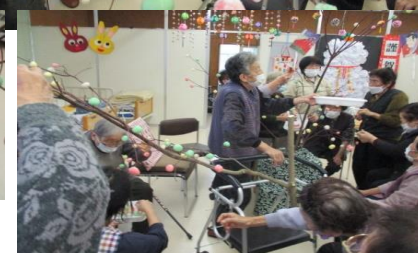
←おやつのだんごも任せて(*^o^*)